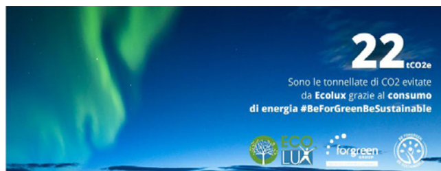
(copertina per pagina Facebook)