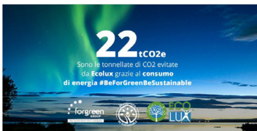
(banner per sito)

5. ECO-KIT digitale , ovvero materiale di comunicazione grafica da pubblicare sul sito internet o sui propri social network, personalizzato con il logo del cliente e con le tonnellate di CO2 risparmiate grazie al consumo di energia verde: